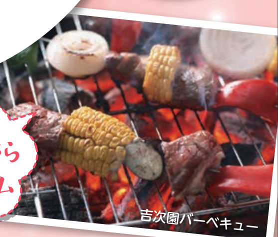
吉次園バーベキュー