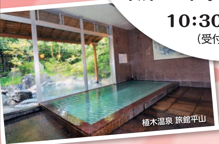
植木温泉 旅館平山